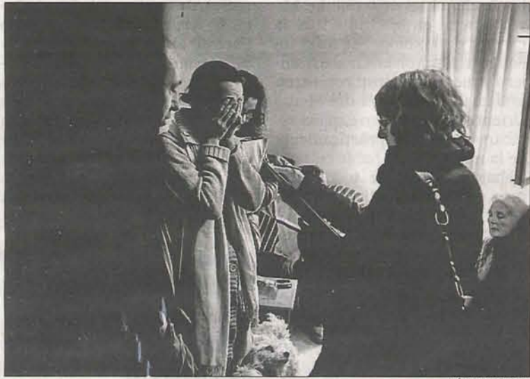
CÍRCULO DEL ARTE

3 Punts renueva su oferta en la primera muestra colectiva de su nuevo local